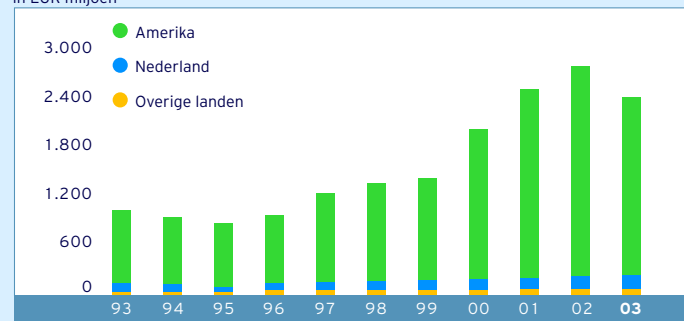
BRUTOPREMIES ZIEKTEKOSTEN- EN ONGEVALLLENVERZEKERING in EUR miljoen